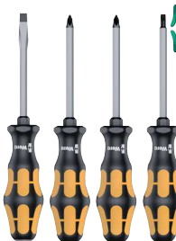
Wera Schraubmeißel Kraffform Plus 900