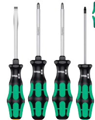
Wera Kraffform Plus 300