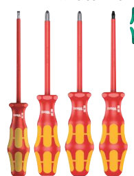
Wera Kraffform Plus 300